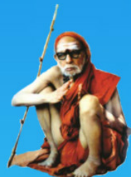
గురు చంద్రశేఖర పరమాచార్య