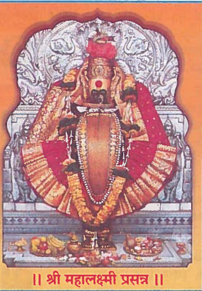
॥ श्री महालक्ष्मी प्रसन्न ॥