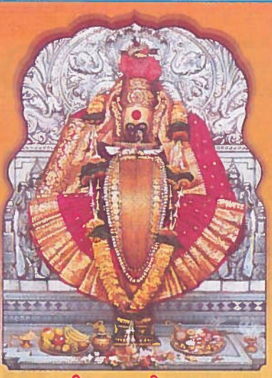
॥ श्री महालक्ष्मी प्रसन्न ॥