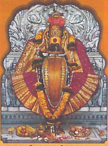
॥ श्री महालक्ष्मी प्रसन्न ॥