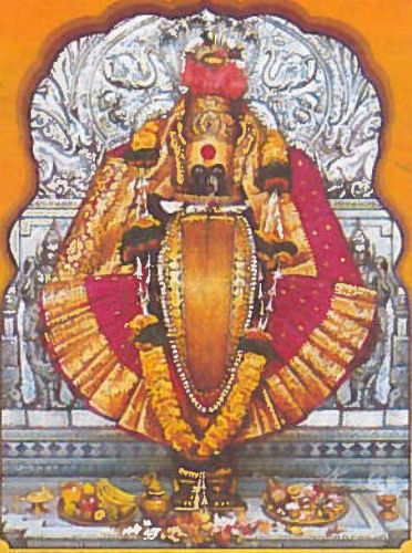
॥ श्री महालक्ष्मी प्रसन्न ॥