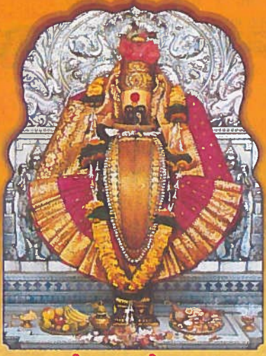
॥ श्री महालक्ष्मी प्रसन्न ॥