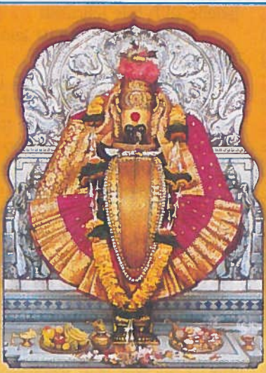
॥ श्री महालक्ष्मी प्रसन्न ॥