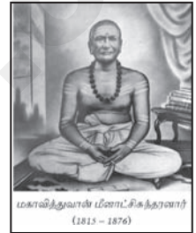
மகாவித்துவான் மீனாட்சிசுந்தரனார் (1815 - 1876)