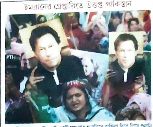
ইমরানের প্রেথুবিতে উত্তপ্ত পাকিস্তান

১০ মে পাঁচটি বিশ্বকাপ খেলা প্রথম মুচিবলার আস্টোনায়ো কার্তাহালের (৯৩) জীবনকাল হল।