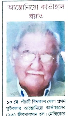
আস্টোনায়ো কার্তাহাল প্রয়াত

৮ মে প্রবর্ত সাহিত্যিক সমাবেশ... ১৯৬৭ সালে দেশ পত্রিকায় তাঁর প্রথম গল্প প্রকাশ হওয়ার মধ্য দিয়ে