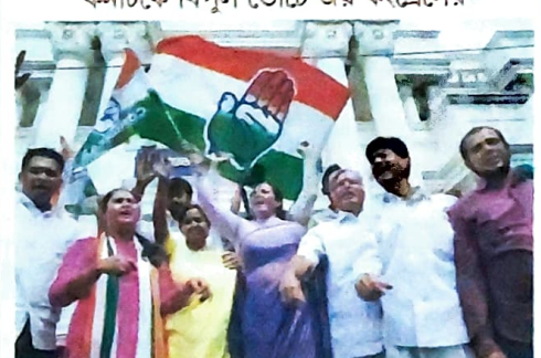
কর্নাটকে বিপুল ভোটে জয় কংগ্রেসের

১১ মে এত পাক্তর ৩৬ হাজার প্রশিক্ষণ... ৩১ মে পবিত্র মসজিদ জমা দেওয়া হবে।