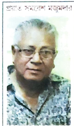
প্রবর্ত সমাবেশ মজুমদার

৬৬ যেখানে পশতুদের আত্মকেই সংসদ থেকে ওয়ে নেওয়া হয়েছে... ৬৬ উনিশটি বিবেচনী দলের যৌথ বিবৃতি