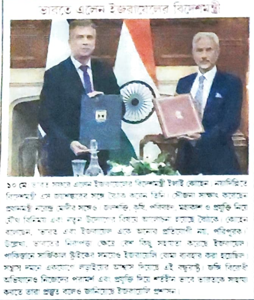
ভারতে এলেন ইজরায়েলের বিদেশমন্ত্রী

বেঙ্গ ইমরানের প্রেথুবিতে... ৩১ মে পবিত্র মসজিদ জমা দেওয়া হবে।